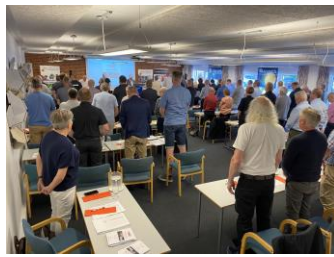
1 minuts stilhed til minde om dem som forlod os