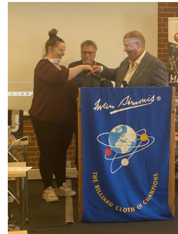
Afgående bestyrelsesmedlem får overrakt vin