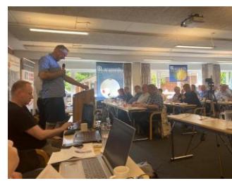
Kai på talerstolen