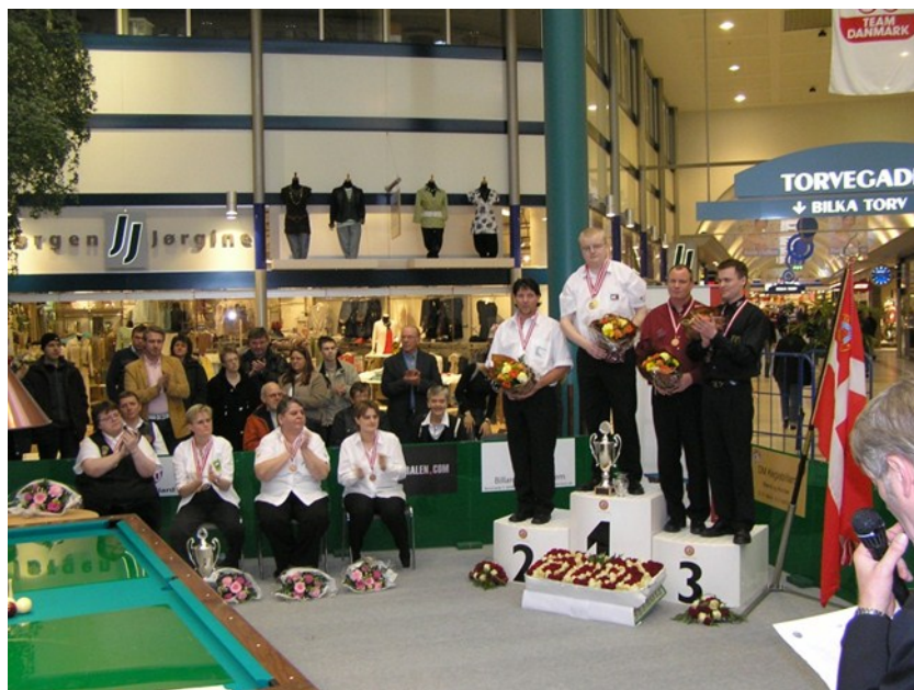
Præmieoverrækkelse i Kolding Storcenter 2006

Og igen i år har vi en anledning til at skulle stå som arrangør af årets DM i keglebillard for kvinder og mænd, idet vores Sportsbygning er blevet reddet, og vi kan blive boende.- Det synes vi ikke vi kan gøre bedre end at arrangere et DM, og samtidig fremvise vores lokaler, ikke mindst for spillere, gæster og byens borgere, men også byens politikere.